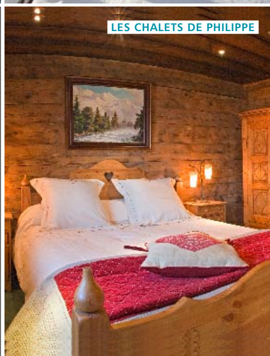
LES CHALETS DE PHILIPPE

Ab 1102 €/Woche, Haus-Nr. IT3420.800.1, www.interhome.de