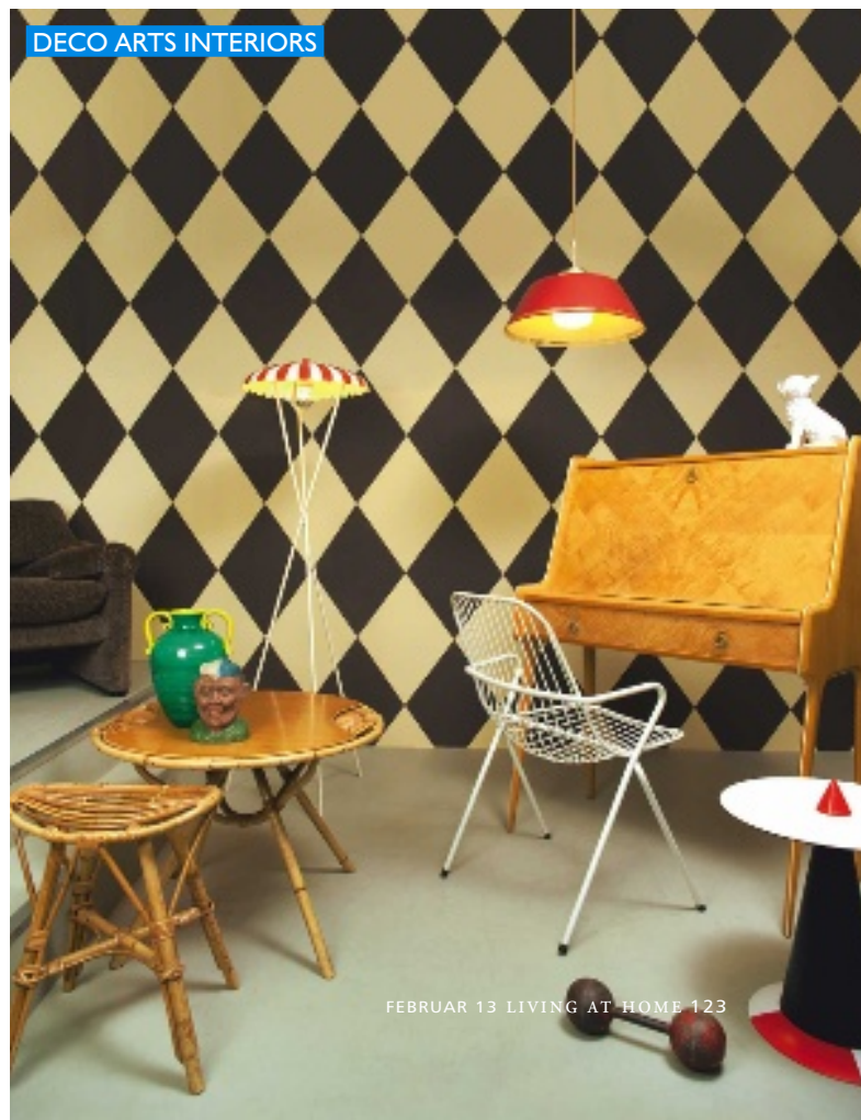
DECO ARTS INTERIORS