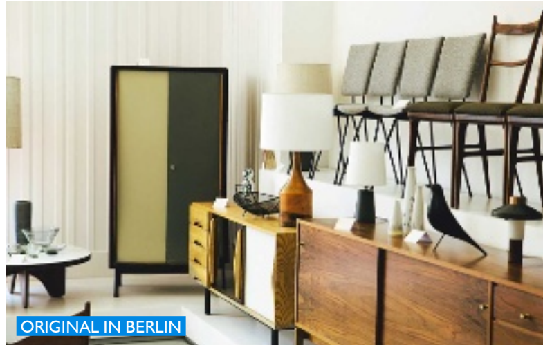
ORIGINAL IN BERLIN

dopo domani Dieses Einrichtungshaus in der Nähe des Savignyplatzes führt u. a. Möbel, Leuchten und Farben von Topmarken wie B & B Italia, Tom Dixon und Farrow & Ball. Mein Tipp: der dazugehörige Accessoires-Shop im Nachbarhaus. Kantstr. 148, Tel. (0 30) 6 88 13 29 99, www.dopo-domani.de