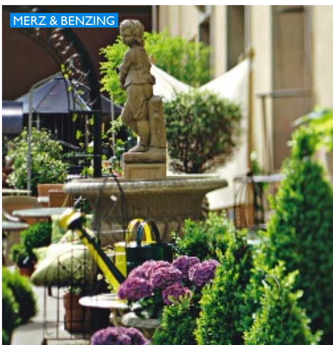
MERZ & BENZING