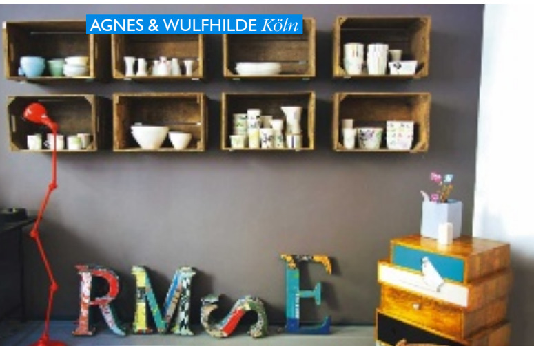
AGNES & WULFHILDE Köln

Ventana, Münster Ventana ist für mich besonders dann einen Besuch wert, wenn ich Freunden aus Münster Einrichtungstipps geben soll. Dann schlendern wir gemeinsam durchs Geschäft und inszenieren im Kopf mögliche Wohnwelten. Ich mag die helle Loftatmosphäre und dass es trotz des umfangreichen Angebots nicht zur Reizüberflutung kommt. Stubengasse 22, Tel. (02 51) 4 07 88, www.ventana-moebel.de