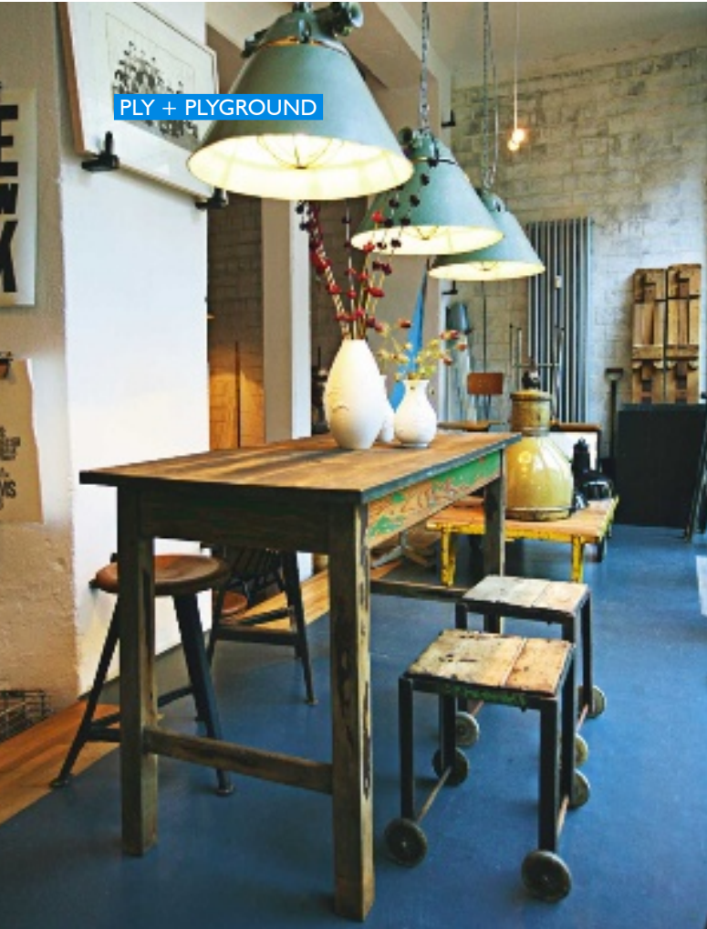
PLY + PLYGROUND