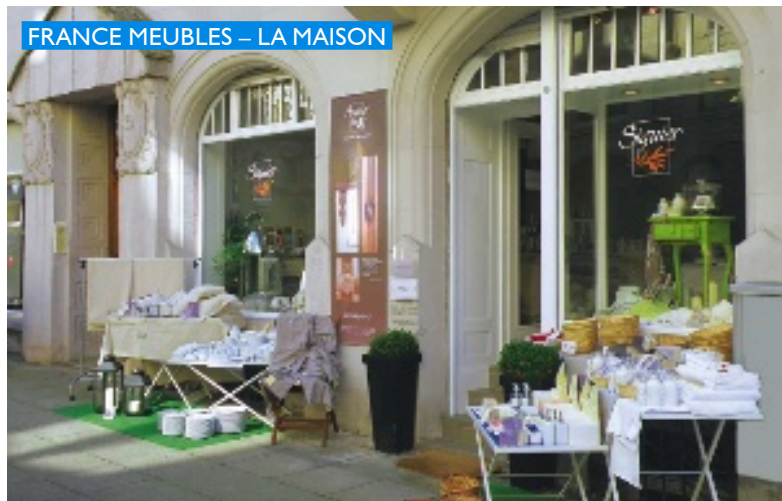
FRANCE MEUBLES – LA MAISON