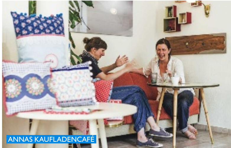
ANNAS KAUF LADENCAFÉ

Merz & Benzing Schon als Kind bin ich mit meiner Mutter gern in die Markthalle gegangen. Seit Merz & Benzing eingezogen ist, noch viel lieber. Ich sage nur: auf drei Etagen Möbel, Geschirr, Accessoires, Kerzen, Textilien, Gartenzubehör, Bücher und der beste Blumenladen der Stadt. Noch Fragen? Dorotheenstr. 4, Tel. (07 11) 2 39 84 15, www.merz-benzing.de