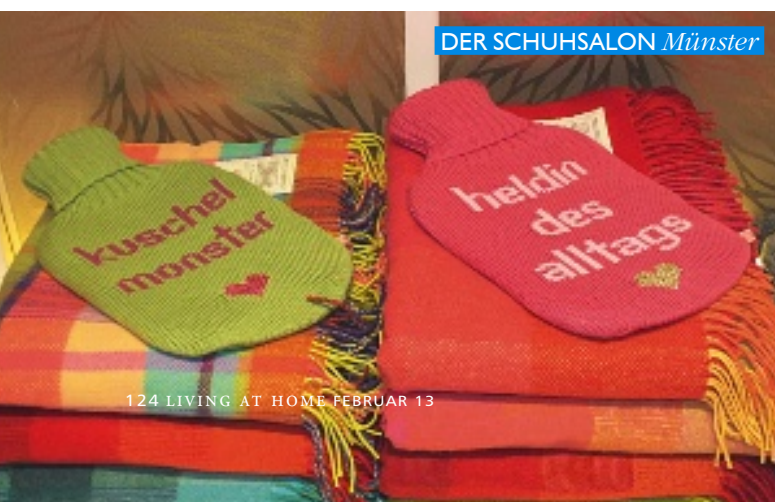
DER SCHUH SALON Münster