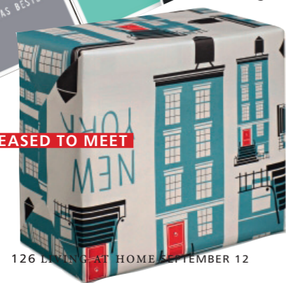
PLEASED TO MEET