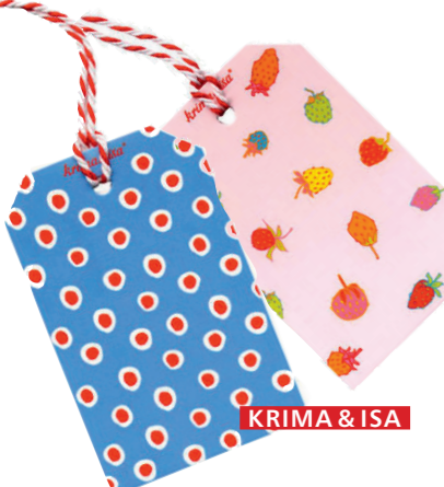
KRIMA & ISA

WER ONLINE BESTELT , BEKOMMT ALLES DIREKT NACH HAUSE AN DEN SCHREIBTISCH DELIVERT