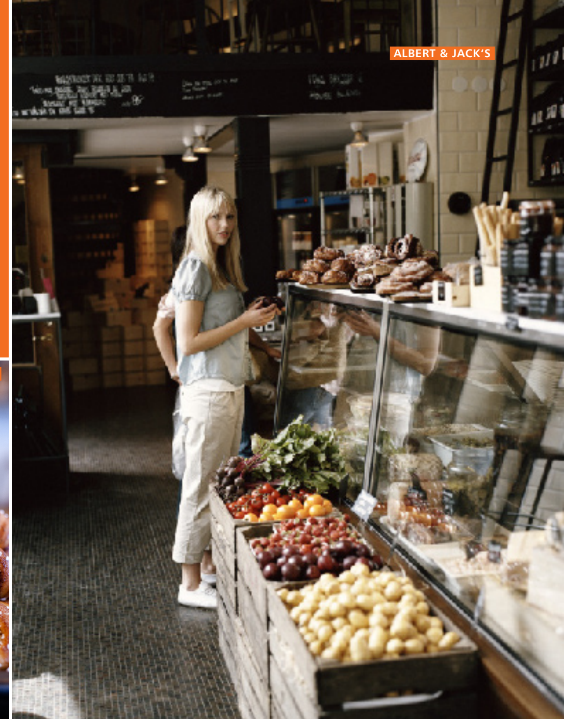
ALBERT & JACK'S

U. a. Engelbrektskatan 3, Mo-Fr 7-17, Sa 8-16 Uhr, Tel. (00 46 8) 6 11 50 01, www.albertjacks.se